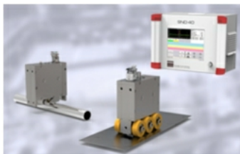
Schweißnahterkennung - Für Rohre, Profile, Coil- und Flachmaterial sowie für Drähte und Seile