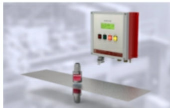
Doppelblecherkennung, Ein- und Zweikopfsysteme für Platinenmaterial